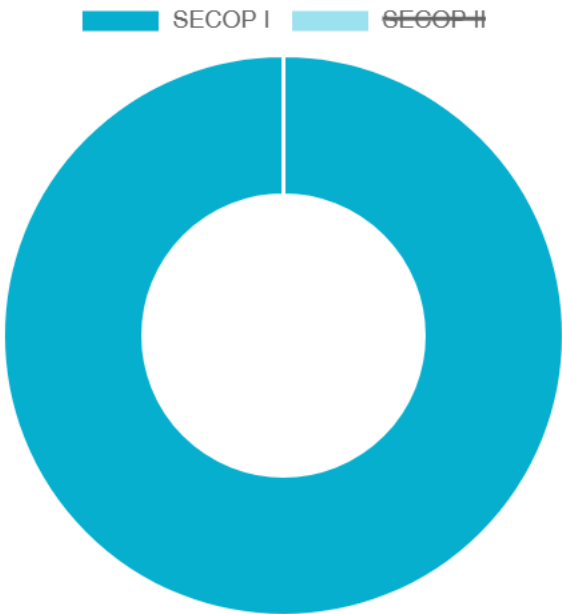
Reporte exploratorio SECOP

Cuantía y número de contratación por año